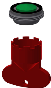
Perlator 5,0 l/min